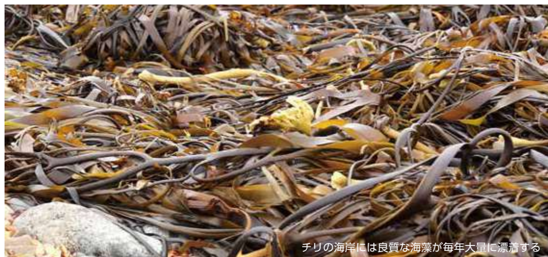
チリの海岸には良質な海藻が毎年大量に漂着する

海藻は地上の植物よりも3~5倍効率よく二酸化炭素を吸収すると言われています。海水を浄化し、海洋生態系の維持にも大きく貢献しています。