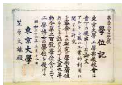
1961年、文雄は東京大学より工学博士の学位を受けた。

文雄は、71歳でその生涯を閉じるまで「海藻化学」の研究に心血を注ぎ、アルギン酸の工業化を成し遂げました。文雄が取得したアルギン酸関連特許は20以上に及び、名実ともに「海藻化学の父」としてアルギン酸の普及・発展を主導しました。