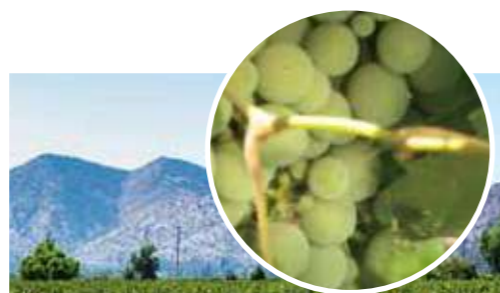
海藻残渣を肥料に利用したチリプラント内のブドウ畑

チリのほぼ中央に位置するマイポバレーは「ラテンアメリカのボルドー」の異名をとる世界的なワインの産地です。温暖でありながら年間の降雨量は少なく、ブドウの栽培には理想的な環境です。