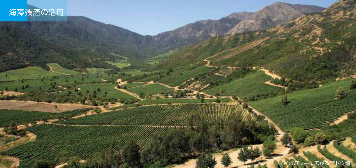
マイポバレーに広がるブドウ畑

アルギン酸を抽出したあとの海藻残渣には良質な肥料として付加価値を付けて農作物の収穫量向上に貢献しています。