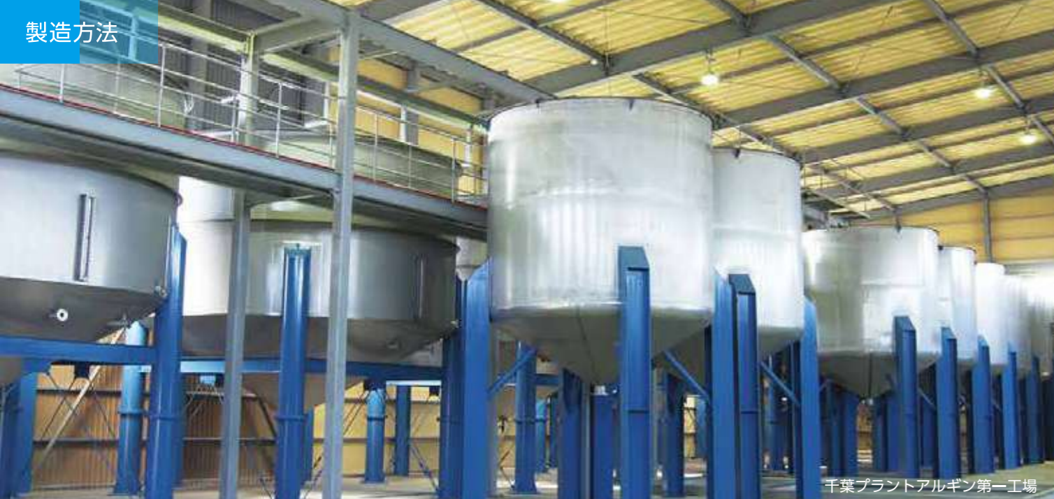
千葉プラントアルギン第一工場