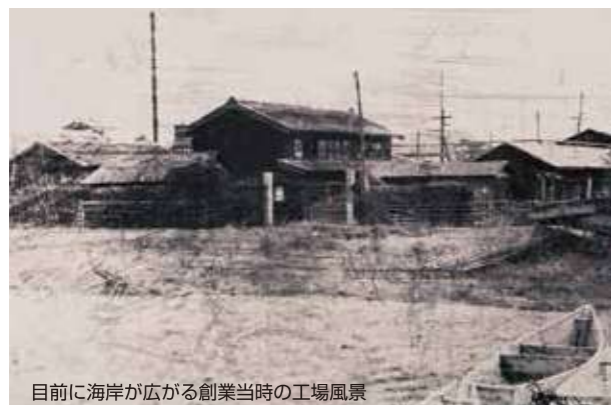
目前に海岸が広がる創業当時の工場風景

「もったいない」 利用されることなく朽ち果てゆく漂着海藻を目にした 創業者のひらめきがKIMICAの原点です。