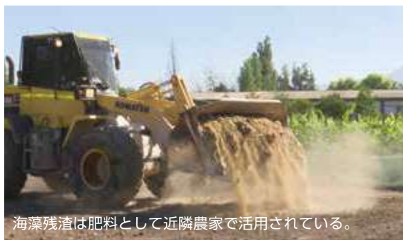
海藻残渣は肥料として近隣農家で活用されている。

KIMICAのチリの工場は、世界的なワインの産地マイポバレーに立地しています。チリプラントは、敷地の半分を緑化しており、海藻残渣を肥料としてワイン用ブドウ栽培にも挑戦しています。KIMICAは、豊かな海の恵みである海藻を余すところなく有効に活用しています。