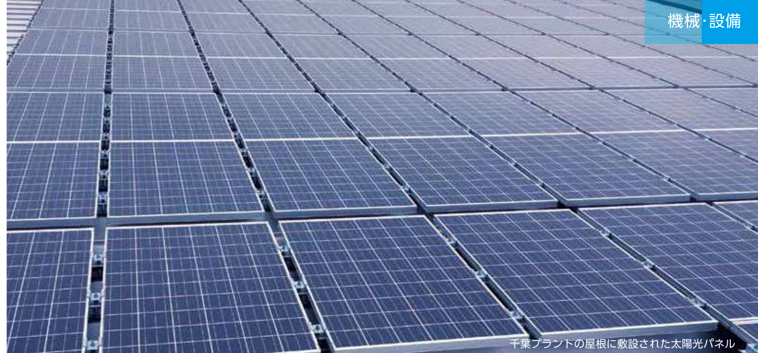
千葉プラントの屋根に敷設された太陽光パネル

KIMICAの工場から出る海藻残渣を良質な肥料として大地に還元できる(9ページ)のは、アルギン酸を分離する工程で化学薬品(ろ剤)を添加していないからです。