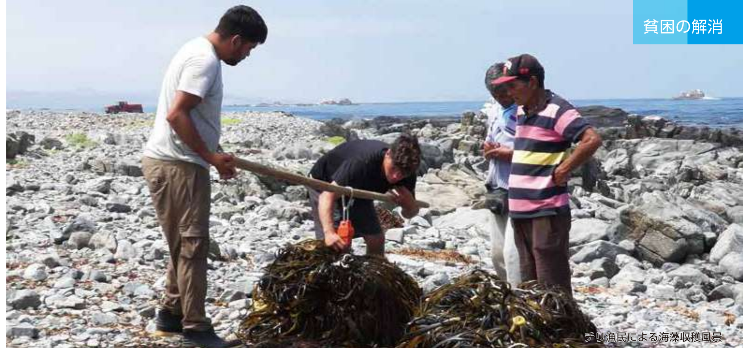
チリ漁民による海藻収穫風景

乾燥した海藻は、チップ状に粉碎してから袋詰めして保管します。チリ国内の工場だけでなく、日本と中国にも運ばれて、アルギン抽出の原料として活用されています。