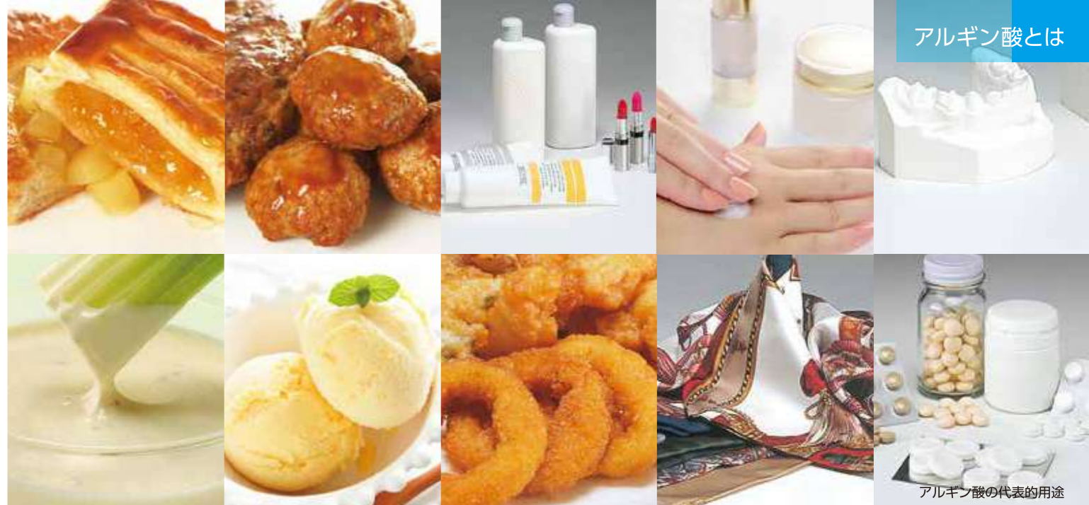
アルギン酸の代表的用途

「もったいない」 利用されることなく朽ち果てゆく漂着海藻を目にした 創業者のひらめきがKIMICAの原点です。