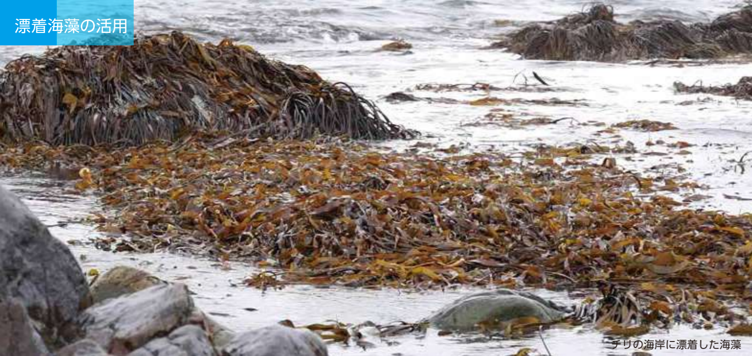
チリの海岸に漂着した海藻