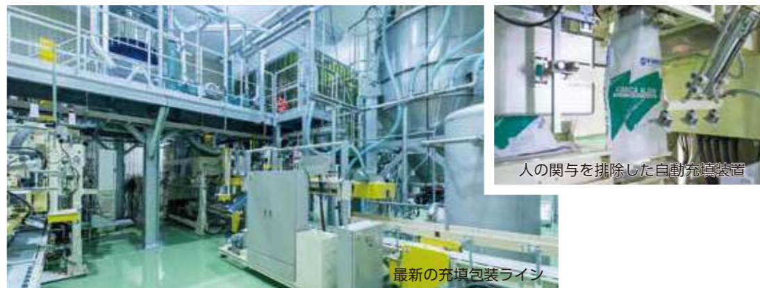
人の関与を排除した自動充填装置

最新の品質調整・充填包装ラインでは自動化によって人の直接的な関与を排除して異物混入リスクを最小化しています。