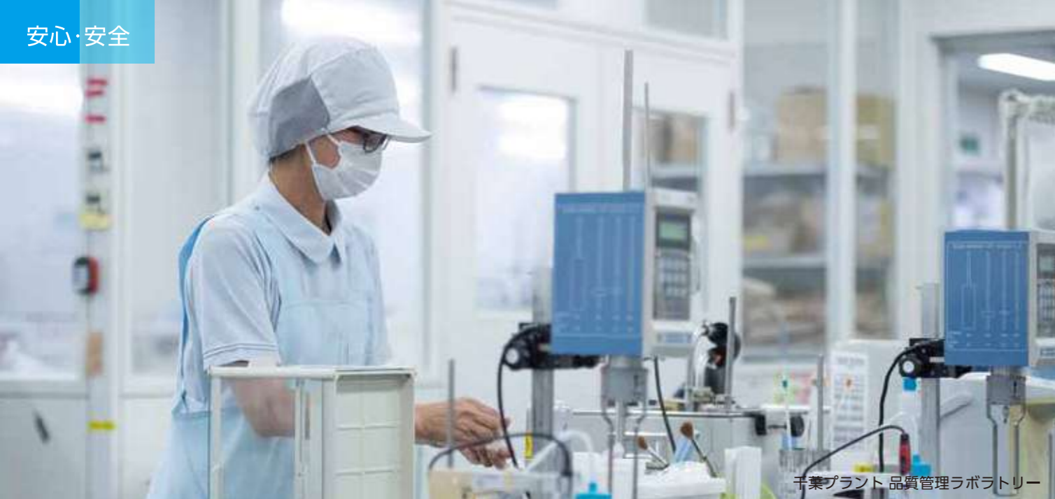
千葉プラント 品質管理ラボラトリー