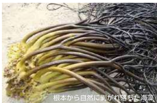
根本から自然に剥がれ落ちた海藻

こうした海藻は硬くて食べられず使い道がないため、長年未利用のまま放置され、二酸化炭素やメタンガスを発生していました。KIMICAは、この“海のゴミ”とも言える漂着海藻に用途を見出し、海洋環境を犠牲にすることなく付加価値の高い素材「アルギン酸」を生み出しています。