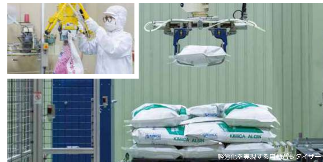
軽労化を実現する自動パレタイザ

ロボット導入による自動化など、 作業員の負担を軽減するための投資も積極的に行っています。