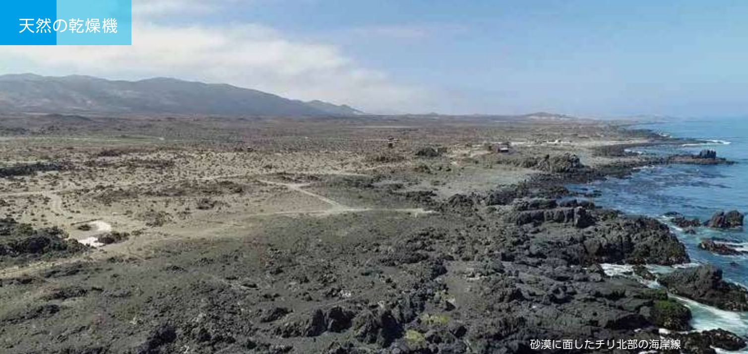
砂漠に面したチリ北部の海岸線

「海藻が自ら“天然の乾燥機”に入ってくる」 アタカマ砂漠に面するチリ北部の海岸は、 海藻の乾燥と保管に最適な環境です。