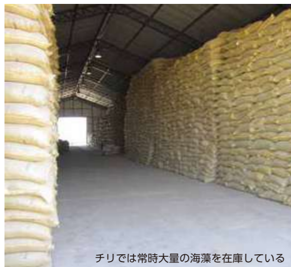
チリでは常時大量の海藻を在庫している

乾燥した海藻は、チップ状に粉碎してから袋詰めして保管します。チリ国内の工場だけでなく、日本と中国にも運ばれて、アルギン抽出の原料として活用されています。