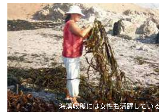
海藻収穫には女性も活躍している

しかし、KIMICAは、長い年月を掛けてチリ現地で強固なサプライチェーンを築き上げており、製造工程に競争力を強化するためのさまざまな工夫を施すことで、経済価値と環境価値を両立しています。