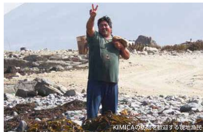
KIMICAの訪問を歓迎する現地漁民

かつて海辺の粗末な掘立小屋で貧しい生活を送っていた漁民は、今では町に立派な家を建てて暮らせるようになりました。経済的な自立によって質の高い教育機会を提供できるようになり、子供を大学に通わせることも珍しくなくなりました。