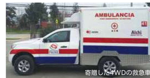
寄贈した4WDの救急車

近隣住民に清潔な水を無償で提供しています。地元の自治体に、日本大使館と共同で日本製の救急車と救助工作車を寄贈し、地域社会の安心・安全にも貢献しています。