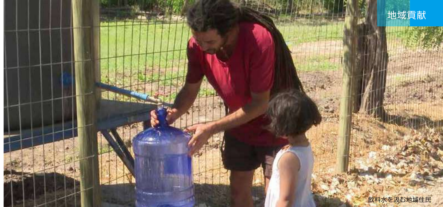
飲料水を汲む地域住民