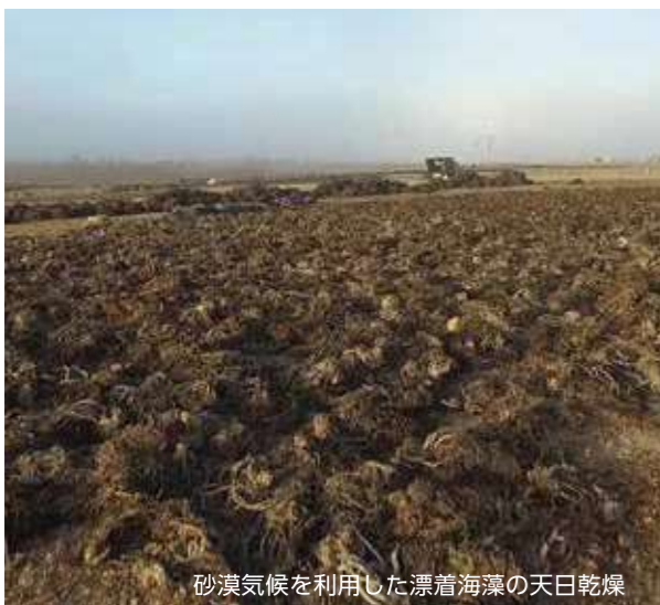
砂漠気候を利用した漂着海藻の天日乾燥

海藻は収穫量に応じて価格が変動する市況商品ですが、KIMICAの大量の在庫が需給のバッファーとなることで価格の乱高下を抑えられ、価格高騰時に誘発される投機的な海藻乱獲の抑止力となっています。