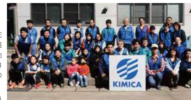
地域清掃に集まったボランティア社員

日本においても、社会福祉向上のための寄附、花火大会への協賛、地域清掃ボランティア活動、高等学校へ出向いての出張授業などに取り組み、地域のまちづくりに貢献しています。最近では、コロナ禍で逼迫する医療体制を支えるため、地域の感染症指定医療機関への寄附も行っています。