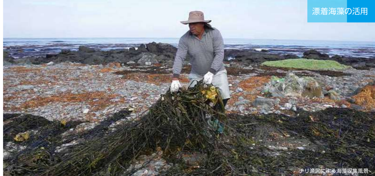
チリ漁民による海藻収集風景

海藻は地上の植物よりも3~5倍効率よく二酸化炭素を吸収すると言われています。海水を浄化し、海洋生態系の維持にも大きく貢献しています。