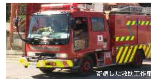
寄贈した救助工作車