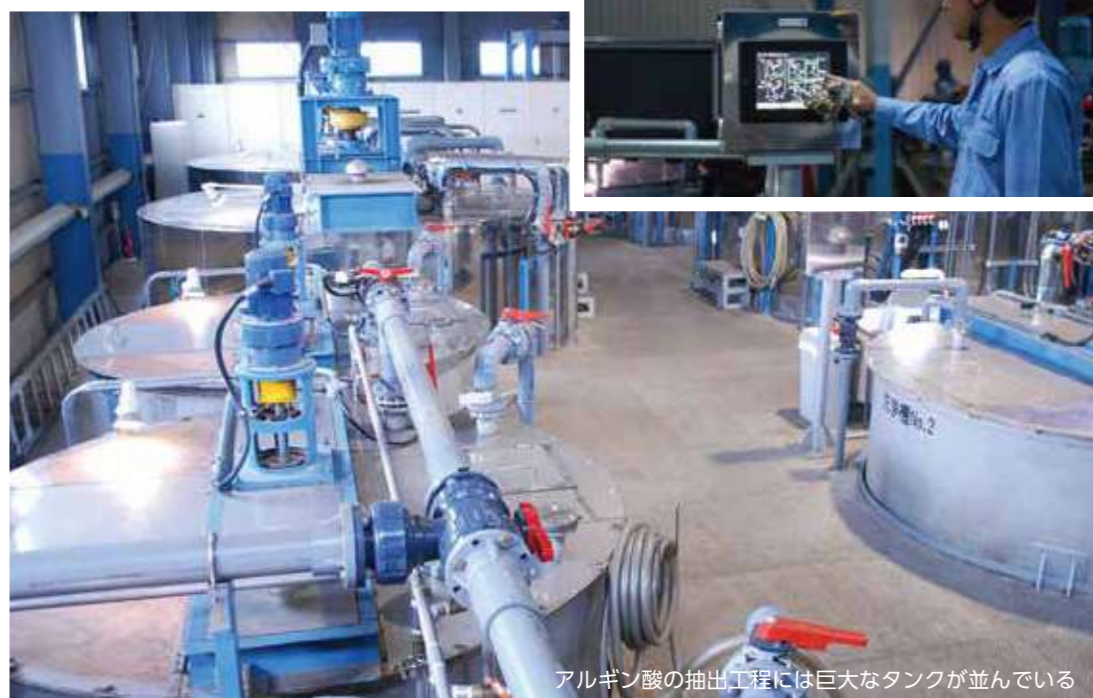
アルギン酸の抽出工程には巨大なタンクが並んでいる

駆使して粉末の白度や溶液の透明度を競い合うなか、KIMICAはアルギン酸に求められる実用物性を見極めて浮上沈降分離法を継続。環境負荷低減とコスト競争力強化を同時に達成したことが、日本唯一のアルギン酸メーカーとして生き残る原動力となりました。