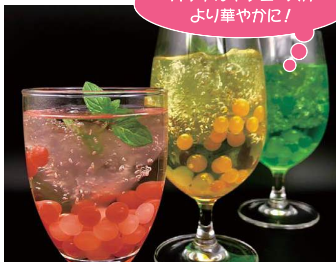
カクテル・ジュース