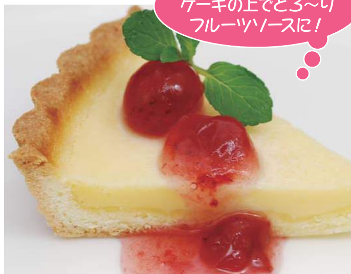
スコーン・クッキー